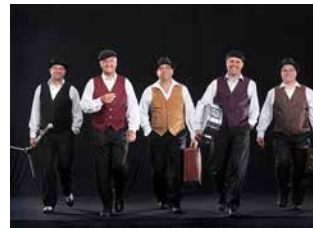
Hot Jazz Revival

Die Blosmaschii ist eine Band aus Löffingen-Unadingen die Jazz, Rock, Pop, Schlager in originelle Bläser Arrangements packt und dann mit Leidenschaft zum Besten gibt. Ihr Leitspruch „Ein Kuss aufs Ohr“ wird immer wieder eindrucksvoll vertont.