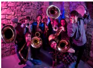
Maddis'son Brass Band