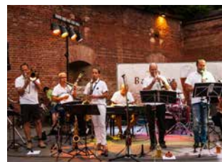
Black Hat Stompers